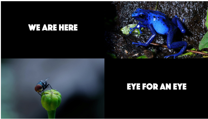
Mercedes Azpilicueta, stillbild från La Facultad , 2017