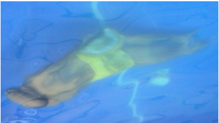
Fabio Kacero, stillbild från Earlater, 2010